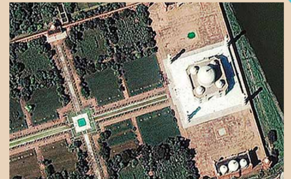
ತಾಜ್ ಮಹಲ್, ಆಗ್ರಾ

ಆದರೆ ಕಂಪ್ಯೂಟರ್ ಇಲಿ(ಮೌಸ್) ಮೇಲೆ ಕೂತರೆ ಮಾತ್ರ! ಹೌದು. ಅಂತರ್ಜಾಲದಲ್ಲಿ ಗೂಗಲ್ ಅರ್ತ್ ಎನ್ನುವ ವಿಶಿಷ್ಟ ಸಂಗತಿಯೊಂದಿದೆ. ಅದನ್ನು ಬಳಸಿ ನೀವು ಕಂಪ್ಯೂಟರ್ ಪರದೆಯ ಮೇಲೆ ನಿಮ್ಮೂರ ಗುಡಿಯನ್ನೂ, ಕೆರೆಯನ್ನೂ ಪತ್ತೆ ಹಚ್ಚಬಹುದು. ನಿಮ್ಮ ಮನೆ ಕಂಡರೂ ಕಂಡೀತು!