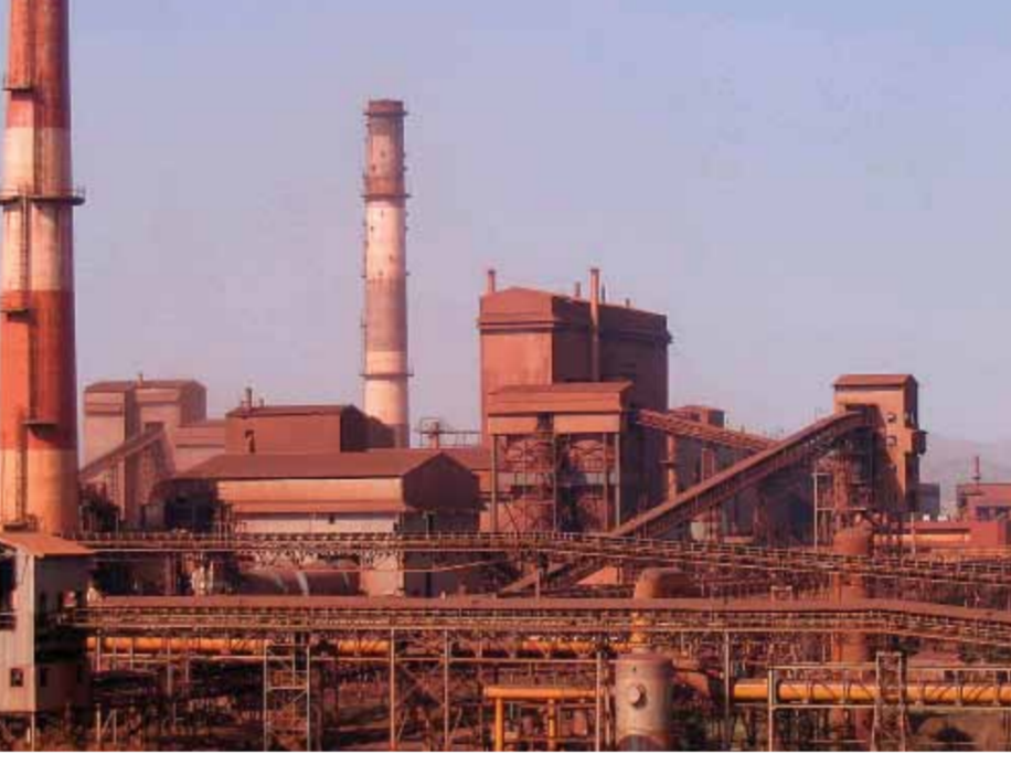
ಭದ್ರಾವತಿ ಕಬ್ಬಿಣ ಮತ್ತು ಉಕ್ಕಿನ ಕಾರ್ಖಾನೆಯ ಮುಖ್ಯಸ್ಥರಾಗಿ ಸೇವೆ

ಅವರ ಜೀವನದ ಪ್ರಮುಖ ಘಟನೆಗಳು 1860 ಚಿಕ್ಕಬಳ್ಳಾಪುರ ಜಿಲ್ಲೆಯ ಮುದ್ದೇನಹಳ್ಳಿಯಲ್ಲಿ ಜನನ 1881 ಪುಣೆಯಲ್ಲಿ ಇಂಜಿನಿಯರಿಂಗ್ ಅಧ್ಯಯನ ಆರಂಭ 1884 ಮುಂಬಯಿ ಪ್ರಾಂತದ ಲೋಕೋಪಯೋಗಿ ಇಲಾಖೆಯಲ್ಲಿ ಉದ್ಯೋಗ. 1902ರವರೆಗೆ ಸೇವೆ. 1909 ಮೈಸೂರು ಸಂಸ್ಥಾನದ ಮುಖ್ಯ ಇಂಜಿನಿಯರ್ ಹುದ್ದೆಯಲ್ಲಿ ಮೂರು ವರ್ಷಗಳ ಕಾಲ ಸೇವೆ 1912 ಮೈಸೂರು ಸಂಸ್ಥಾನದ ದಿವಾನರಾಗಿ ಆರು ವರ್ಷಗಳ ಕಾಲ ಸೇವೆ. 1915 ಬ್ರಿಟಿಷ್ ಆಡಳಿತದಿಂದ ನೈಟ್‌ಹುಡ್ 1923