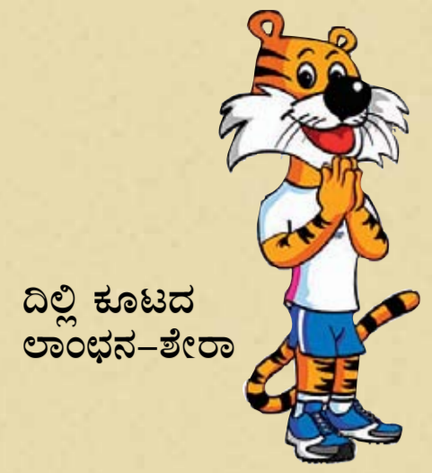
ದಿಲ್ಲಿ ಕೂಟದ ಲಾಂಛನ-ಶೇರಾ

ಇತ್ತೀಚೆಗೆ ಗಮನ ಸೆಳೆದ ಎರಡು ಪ್ರಮುಖ ಕ್ರೀಡಾಕೂಟಗಳೆಂದರೆ ದೆಹಲಿಯಲ್ಲಿ ನಡೆದ ಕಾಮನ್‌ವೆಲ್ತ್ ಆಟಗಳು ಹಾಗೂ ಚೀನಾದಲ್ಲಿ ನಡೆದ ಏಷ್ಯನ್ ಕ್ರೀಡೆಗಳು. ಎರಡರಲ್ಲೂ ಭಾರತೀಯ ಆಟಗಾರರು ಉತ್ಕೃಷ್ಟ ಸಾಧನೆ ತೋರಿದರು.