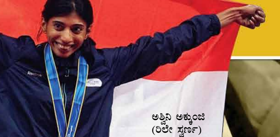
ಅತ್ತಿನಿ ಅಕ್ಕುಂಜಿ (ರಿಲೇ ಸ್ವರ್ಣ)

ಆದರೆ ಹರ್ಯಾಣ ರಾಜ್ಯದ ಸಾಧನೆ ಬೆರಗು ಹುಟ್ಟಿಸುವಂಥದು. ಭಾರತ ಕಾಮನ್‌ವೆಲ್ತ್‌ನಲ್ಲಿ ಗಳಿಸಿದ 38 ಚಿನ್ನದ ಪದಕಗಳಲ್ಲಿ 19 ಪದಕಗಳನ್ನು ಹರ್ಯಾಣದ ಆಟಗಾರರೇ ಗೆದ್ದಿದ್ದಾರೆ. ದೇಶ ಗೆದ್ದ ಒಟ್ಟು 101 ಪದಕಗಳಲ್ಲಿ ಹರ್ಯಾಣದ ಕೊಡುಗೆ 37.