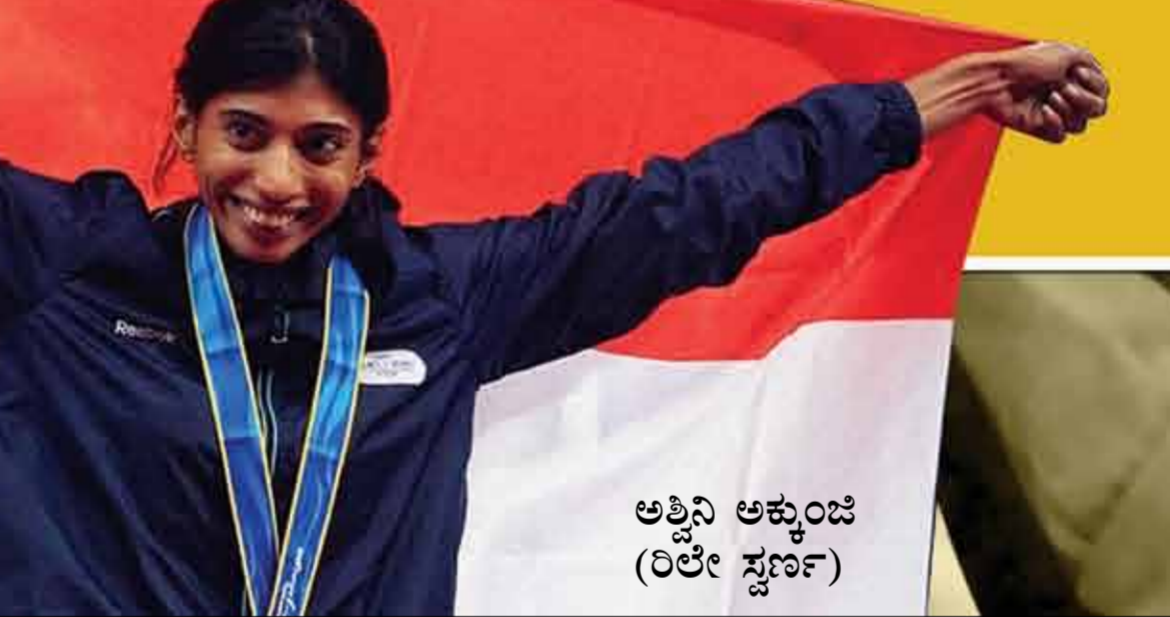
ಅತ್ತಿನಿ ಅಕ್ಕುಂಜಿ (ರಿಲೇ ಸ್ವರ್ಣ)

ಆದರೆ ಹರ್ಯಾಣ ರಾಜ್ಯದ ಸಾಧನೆ ಬೆರಗು ಹುಟ್ಟಿಸುವಂಥದು. ಭಾರತ ಕಾಮನ್‌ವೆಲ್ತ್‌ನಲ್ಲಿ ಗಳಿಸಿದ 38 ಚಿನ್ನದ ಪದಕಗಳಲ್ಲಿ 19 ಪದಕಗಳನ್ನು ಹರ್ಯಾಣದ ಆಟಗಾರರೇ ಗೆದ್ದಿದ್ದಾರೆ. ದೇಶ ಗೆದ್ದ ಒಟ್ಟು 101 ಪದಕಗಳಲ್ಲಿ ಹರ್ಯಾಣದ ಕೊಡುಗೆ 37.