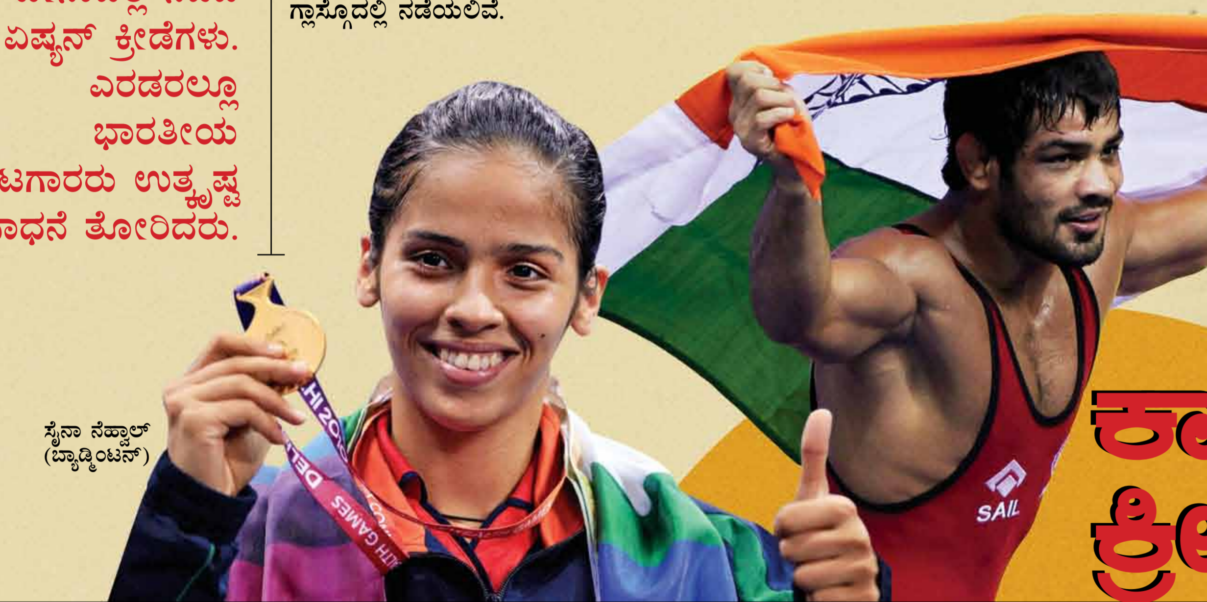
ಸೈನಾ ನೆಹ್ರಾಲ್ (ಬ್ಯಾಡ್ಮಿಂಟನ್)

ಕ್ರೀಡಾಗ್ರಾಮದಲ್ಲಿ ವ್ಯವಸ್ಥೆಗಳು ಸರಿಯಿಲ್ಲ, ಭ್ರಷ್ಟಾಚಾರ ನಡೆದಿದೆ ಎಂಬ ಅಪಸ್ವರಗಳ ನಡುವೆಯೂ ಭಾರತ ಮೊದಲಬಾರಿಗೆ ಆಯೋಜಿಸಿದ ಈ ಕ್ರೀಡಾಕೂಟ ಯಶಸ್ವಿಯಾಗಿ ಕೊನೆಗೊಂಡು ವಿಶ್ವದ ಗಮನ ಸೆಳೆಯಿತು. ಭಾರತ ಹಿಂದೆಂದೂ ಇಲ್ಲದಷ್ಟು ಚಿನ್ನದ ಪದಕಗಳನ್ನು ಗೆದ್ದು ಪಟ್ಟಿಯಲ್ಲಿ ಎರಡನೇ ಸ್ಥಾನದೊಂದಿಗೆ ಸಂಭ್ರಮಿಸಿತು. ನಾಲ್ಕು ವರ್ಷಗಳಿಗೊಮ್ಮೆ ನಡೆಯುವ ಕಾಮನ್‌ವೆಲ್ತ್ ಕ್ರೀಡಾಕೂಟಗಳು 2014ರಲ್ಲಿ ಸ್ಯಾಟ್‌ಲ್ಯಾಂಡ್‌ನ ಗ್ಲಾಸ್ಗೊದಲ್ಲಿ ನಡೆಯಲಿವೆ.