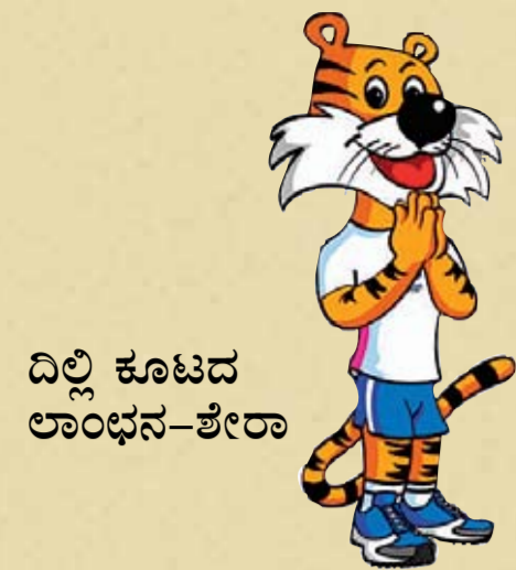
ದಿಲ್ಲಿ ಕೂಟದ ಲಾಂಛನ-ಶೇರಾ

ಇತ್ತೀಚೆಗೆ ಗಮನ ಸೆಳೆದ ಎರಡು ಪ್ರಮುಖ ಕ್ರೀಡಾಕೂಟಗಳೆಂದರೆ ದೆಹಲಿಯಲ್ಲಿ ನಡೆದ ಕಾಮನ್‌ವೆಲ್ತ್ ಆಟಗಳು ಹಾಗೂ ಚೀನಾದಲ್ಲಿ ನಡೆದ ಏಷ್ಯನ್ ಕ್ರೀಡೆಗಳು. ಎರಡರಲ್ಲೂ ಭಾರತೀಯ ಆಟಗಾರರು ಉತ್ಕೃಷ್ಟ ಸಾಧನೆ ತೋರಿದರು.